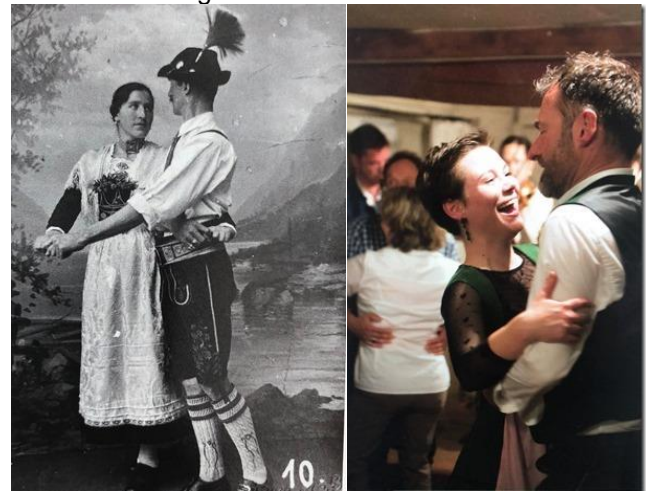
Volkstanz früher und heute

Nach zwei Jahren Pause ist es endlich wieder soweit. Wir feiern Seefest – und zwar am 25./26. Juni 2022 ab 19 Uhr am Oggenrieder Weiher. Und es wird ein besonderes Erlebnis werden, denn wir feiern gleichzeitig unser 100-jähriges Vereinsjubiläum. Aus diesem Anlass gibt es am Samstag, dem 25. Juni, einen großen Volkstanzabend am See. Dabei soll auch Tanzmusik erklingen, wie sie Blaskapellen schon vor vielen Jahrzehnten im Repertoire hatten. Egal ob jung oder älter, groß oder klein, erfahrener Tänzer oder absoluter Laie - mitmachen können alle, die einfach Spaß am Tanzen haben. Es darf gestampft, geklatscht, gelacht werden. Nichts wird perfekt sein, die Freude überwiegt.