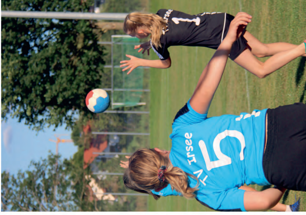
Mit Begeisterung bei der Sache. Beim Korbball wird ohne Körperkontakt gespielt.

Eigentlich ist Korbball eine eher unbekannte Sportart. Im Allgäu wird sie in vielen Dörfern und Gemeinden gespielt. Was ist so faszinierend an diesem Spiel, wie funktioniert es und warum sind nur Mädels dafür zu begeistern? Wir sprechen mit zwei langjährigen Irseer Spielerinnen.