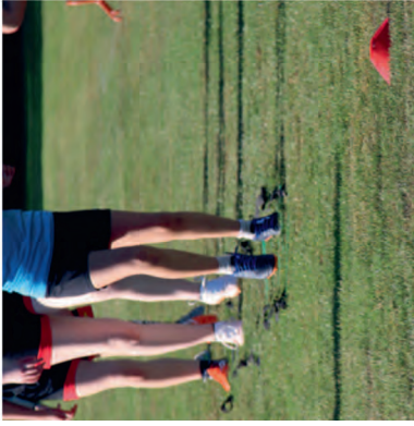
Beinarbeit gehört mit dazu.

Es ist ein schneller Sport, mit ständigem Wechsel zwischen Angriff und Abwehr, was ein sofortiges blitzschnelles Umschalten erfordert. Für die Feldsaison von Mai bis Juli tragen deshalb die Spielerinnen Stollenschuhe, wie die Fußballkollegen. Vereinfacht könnte man sagen, es ist eine Mischung aus Handball und Basketball. Der Spielgedanke ist wie beim Basketball, die Spielzüge ähneln dem Handball und getroffen wird nicht ein Tor, sondern ein Korb.