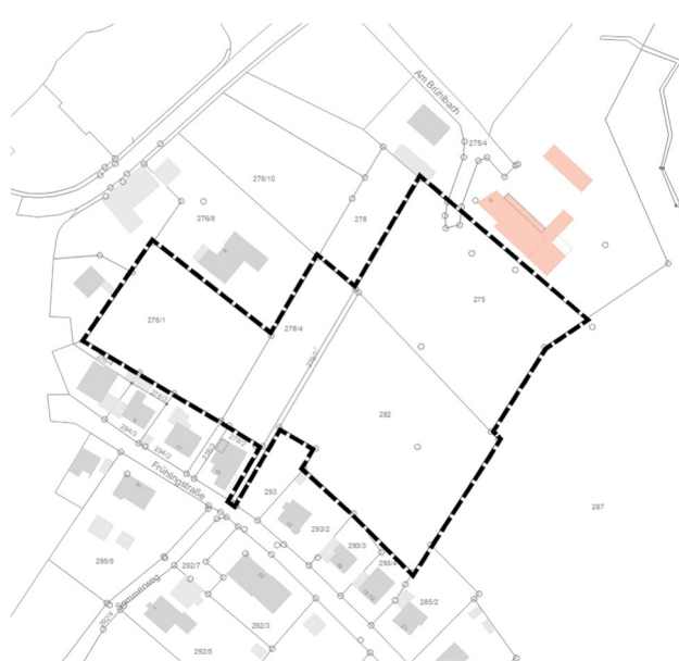
Abbildung 2: Geltungsbereich des gegenständlichen Bebauungsplanes, unmaßstäblich