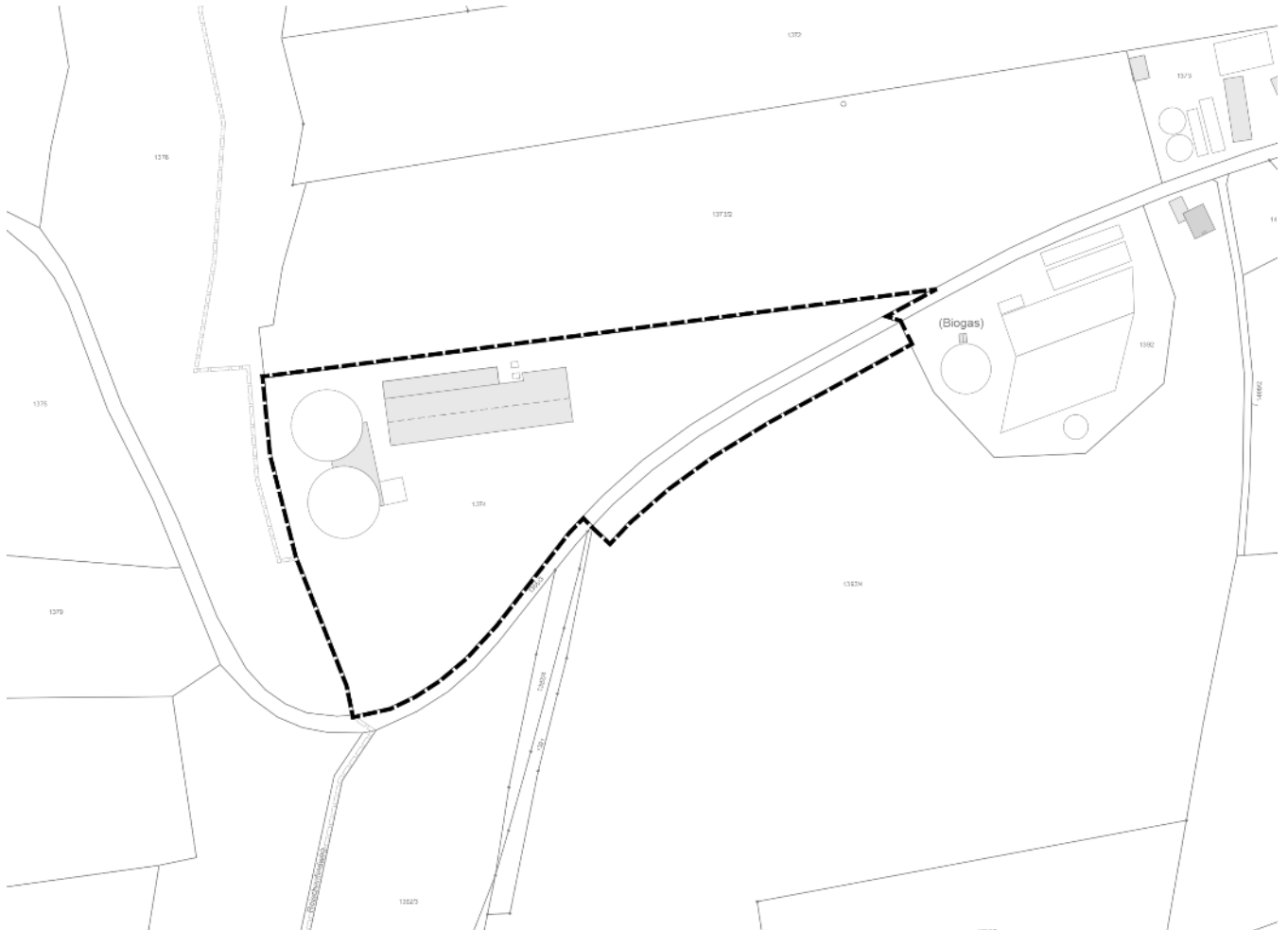
Abbildung 1: Lageplan des Bebauungsplanes „Sondergebiet Biogasanlagen in Oggenried“, 3. Änderung, unmaßstäblich

Das Plangebiet weist eine Größe von ca. 2,3 ha auf. Die genaue Lage des Plangebietes ist der Bebauungsplanzeichnung zu entnehmen (siehe auch Abbildung 1).