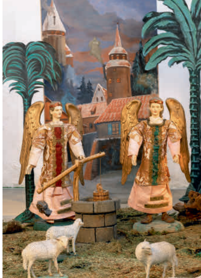
Abb. 8: Prächtige Engel vor mittelalterlicher Stadtkulisse.