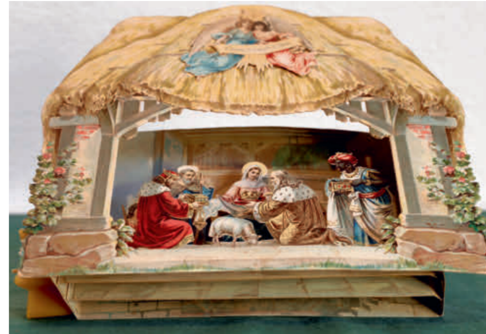
Abb. 11: Ist die Kulissenkrippe aufgefaltet, stehen die Figuren wie auf einer Bühne.

Nur wenige Jahre später kamen die ersten geprägten und ausgestanzten Chromolithografien auf den Markt. Mit diesen Buntdrucken entstand auch ein neuer Industriezweig: die Luxuspapierfabrikation. Und mit ihr gab es immer neue Varianten der Papierkrippen, wie z. B. die Fal- und Klappkrippen oder die Kulissen-