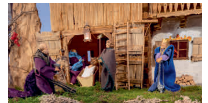
Abb. 5: Die Könige werden mehrfach umgestellt.

Günter Zurek, Ehren- und Gründungsmitglied des TV Irsee, starb 2019 mit 91 Jahren. Doch seine Krippe besteht fort. Sie ist der Lohn einer guten Tat, ein Geschenk und ein Zeichen für das fleißige Engagement vieler Hände. Und so können Besucherinnen und Besucher, die der Aufforderung »Komm rein zum Krippele-Luaga« an der Kirchentür folgen, in jeder Weihnachtszeit eine Krippe mit seltenem Detailreichtum betrachten.