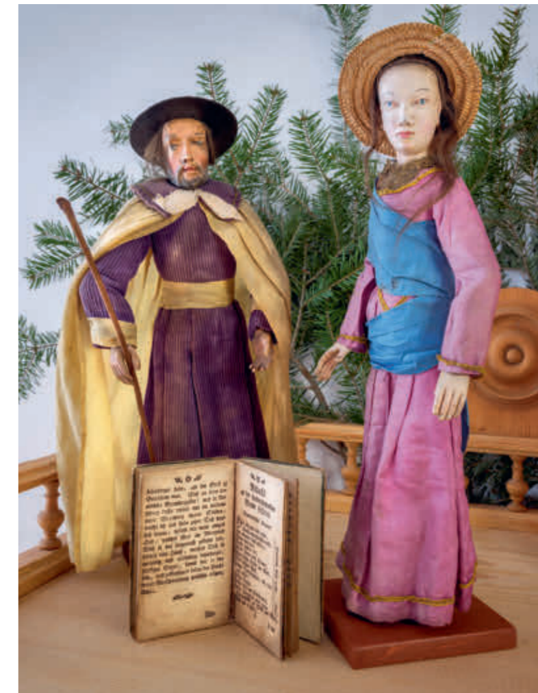
Abb. 30: Maria und Josef mit Begleitbuch aus dem Jahr 1780.