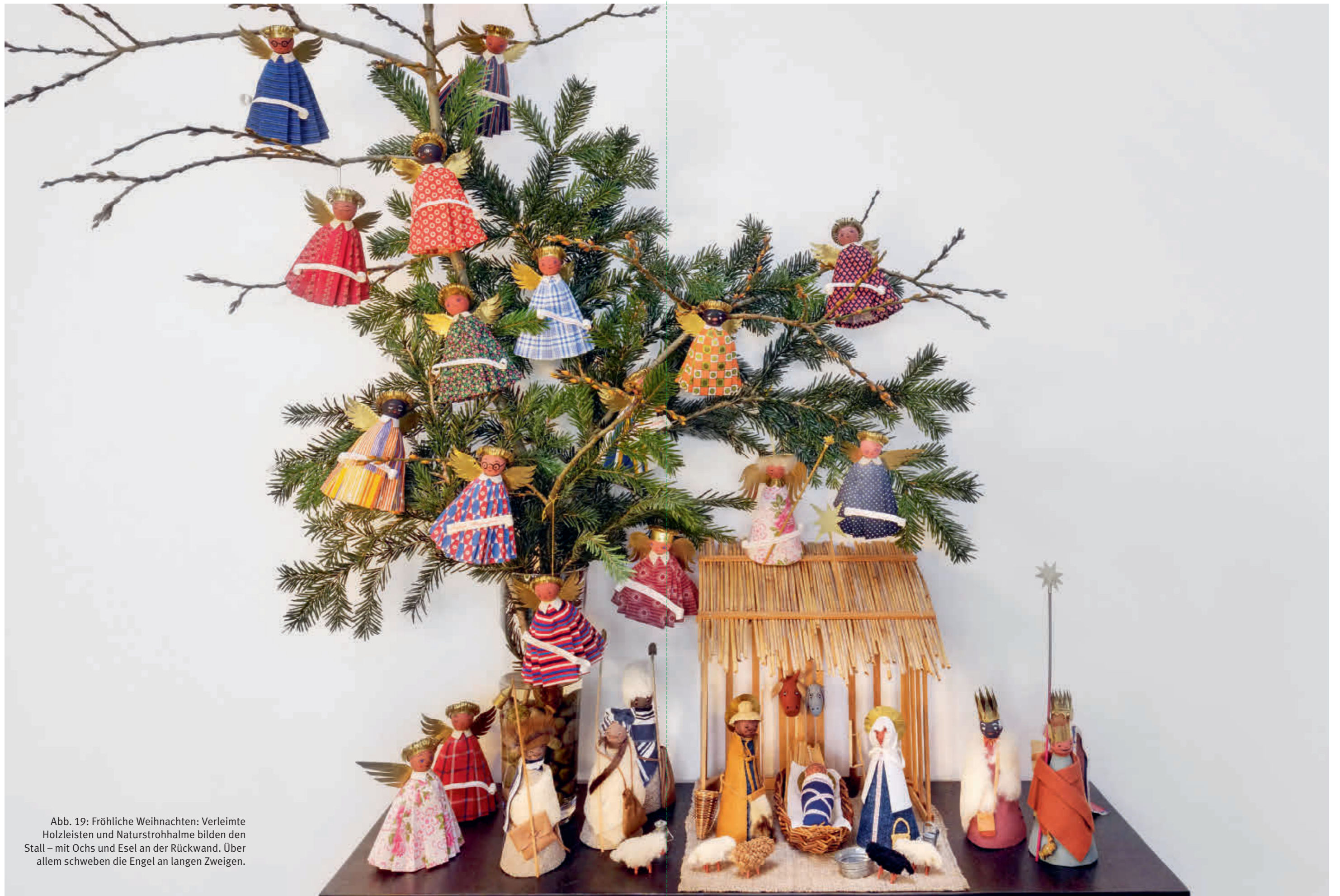
Abb. 19: Fröhliche Weihnachten: Verleimte Holzleisten und Naturstrohhalm bilden den Stall – mit Ochs und Esel an der Rückwand. Über allem schweben die Engel an langen Zweigen.