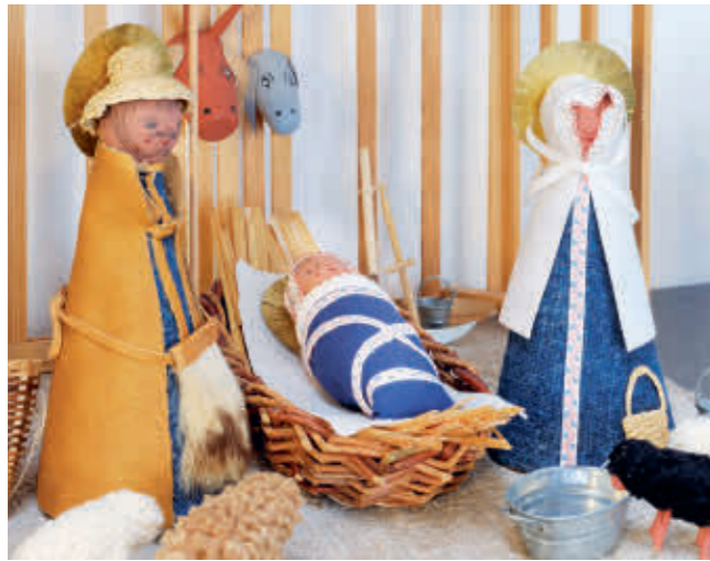
Abb. 15: Die Heilige Familie mit Ochs und Esel.

später auch Osterlämmer in unterschiedlichen Größen. Die Krippenfiguren waren bei den Landshutern so begehrt, dass man sie lange im Voraus bestellen und mit viel Geduld auf deren Fertigstellung warten musste. Anders als bei den Dioramen barocker Krippen mit ihren vielfältigen Figurengruppen, die sich auf Szenen des Alten und Neuen Testaments oder Alltagsszenen beziehen, bestand eine Stälinger-Krippe aus der überschaubaren Anzahl folgender Figuren: der Heiligen Familie, also dem Jesuskind mit Maria und Josef. Ochs und Esel waren nie als ganze Figuren, sondern lediglich