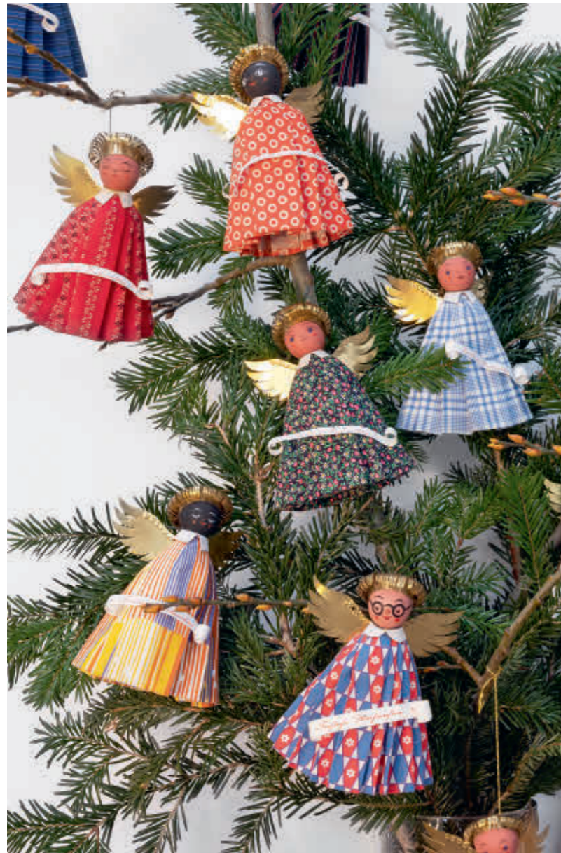
Abb. 20: Jeder Engel ein Unikat mit goldenem Krönchen.

das Christkind. Kurz bevor das Glöckchen bimmelte, verschwand meine Mutter unauffällig. Dann war die Tür zum Bescherungszimmer geöffnet und die Kerzen am Christbaum waren angezündet. Artig stimmten wir vor dem festlich leuchtenden Weihnachtsbaum das „Stille Nacht, heilige Nacht“ an. Mehr als der Krippe galt unser Interesse den Geschenken, die das Christkind gebracht hatte. Zu Beginn des Advents hatten wir unsere sehnlichsten Wünsche sorgfältig aus Spielzeugkatalogen ausgeschnitten, auf Wunschzettel geklebt und mit unserer schönsten Schrift und vielen Schnörkeln liebevoll verziert. Die an die Außenseite der großen Glaschiebetür geklebten Briefe, die mit „Liebes Christkind, bitte bringe mir ...“ begannen und mit „Vielen, vielen Dank und liebe Grüße von ...“ endeten, waren am nächsten Morgen verschwunden. Viele dieser Rituale wurden über die Jahre so zur Tradition, dass meine Mutter, als sie vorschlug, den Weihnachtsbaum gemeinsam zu