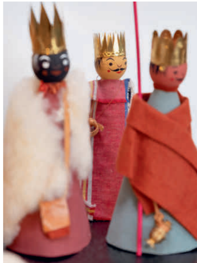
Abb. 17: Die Heiligen Könige aus dem Morgenland.

Die Figuren haben keine Gliedmaßen. Sie bestehen lediglich aus dem Konstrukt einer gedrehten Holz- kugel als Kopf und daran befestigt eines textilen Kegel- stumpfs als Körper. Die bunt gemusterten Baumwoll- stoffe spiegeln anschaulich die Vorlieben und Moden der jeweiligen Jahrzehnte wider, sodass es einem Ken-