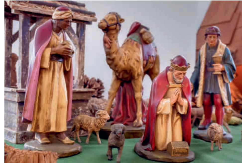
Abb. 25: Die Weisen.