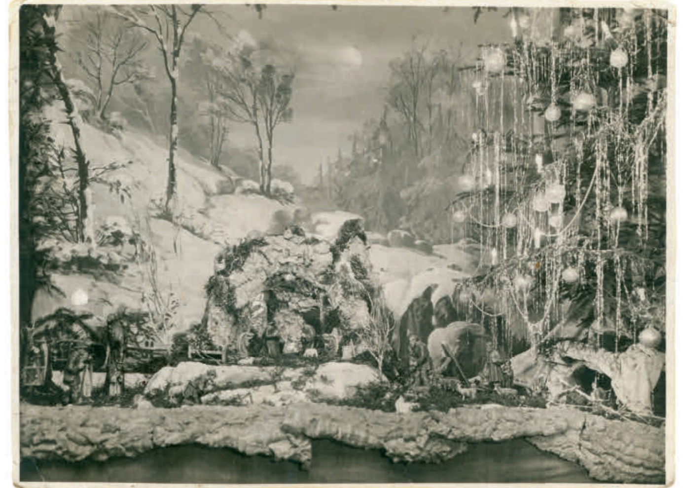
Abb. 21: Krippe vor Winterlandschaft im Köln der 1930er-Jahre.

Zur Hochzeit übergab mir meine Mutter einen Karton mit einer kompletten Stälinger-Krippe. Ich war gerührt und glücklich, da ich einen Teil meiner Kindheit in Händen hielt – mit vielen Erinnerungen an Rituale, die zur Tradition geworden waren, und somit ein Stück Heimat. Als wir von Aschaffenburg hierher ins Allgäu gezogen waren und nachdem unsere Tochter geboren war, übergab mir eines Tages der Postbote ein weiteres Paket. Darin fand ich gut ein Dutzend Engel, die seither an langen Zweigen befestigt gleichsam den Himmel über der weihnachtlichen Krippe bevölkern und diese komplettieren. Mit dem Spruchband „Fröhliche Weihnachten“ vor ihrer Brust kündeten diese wiederkehrend von der Geburt des christlichen Erlösers. Wie gut es doch von meiner Mutter gewesen war, mit einem Engel anzufangen!