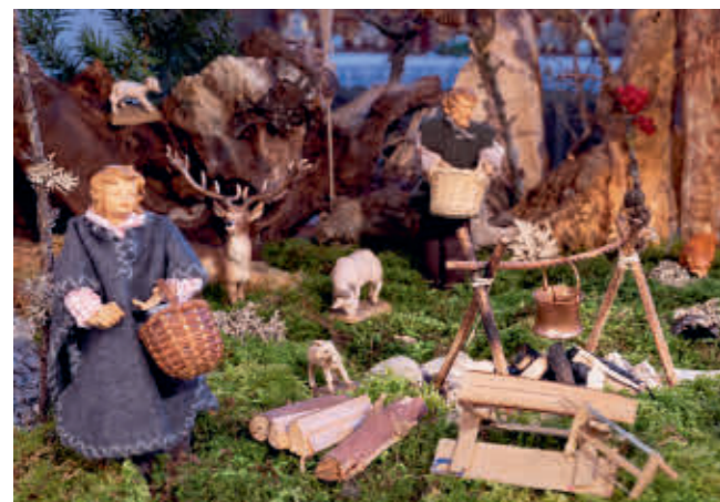
Abb. 2: Die Tiere und Figuren sind auf Moos gebettet.