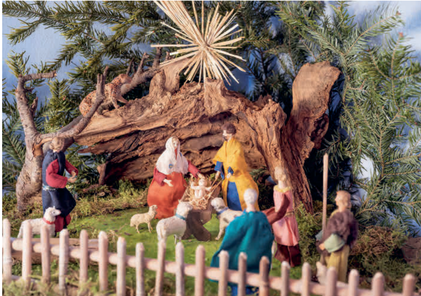
Abb. 32: Die Figuren werden in wechselnden Szenen eingesetzt.

wurden verschenkt oder in den Kriegsjahren gegen Nahrungsmittel getauscht. Außerdem sorgten Mäuse auf dem alten Dachboden, auf dem die Krippe gelagert wurde, für Beschädigungen an Wachsteilen und Kleidern der Figuren. Sie wurden lange Zeit nicht mehr aufgestellt. Später wurden die beschädigten Teile der Figuren durch Masse aus Holzmehl, Leim, Mehl, Ton, Papierfasern, Gips und dergleichen ersetzt und die textilen Kleider wieder restauriert. Für Alfons Königspurger ist die jährlich aufgestellte Krippe bei seiner Großtante aus der Kindheit nicht wegzudenken. Sie baute ein paar Szenen in stark verkleinertem Umfang wieder auf. Am schönsten fand er die selten aufgestellte Darstellung der Hochzeit zu Kana. Besonders fasziniert habe ihn dabei das winzige Geschirr samt Besteck bei der großen Hochzeitstafel.