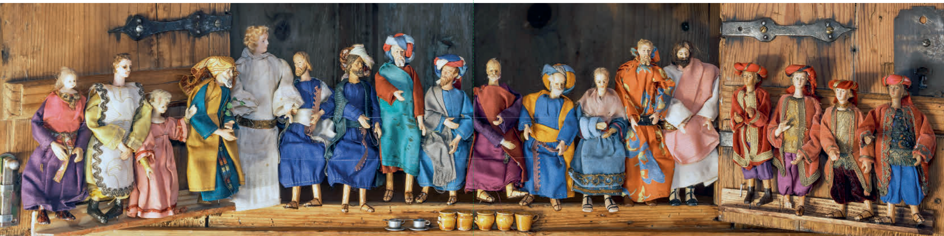
Abb. 31: Figuren einer schwäbischen Wechselkrippe – mutmaßlich aus dem 18. Jahrhundert.

Leider wurde dieser Bestand mit den Jahren erheblich dezimiert. Teile gingen kaputt oder verloren, Figuren