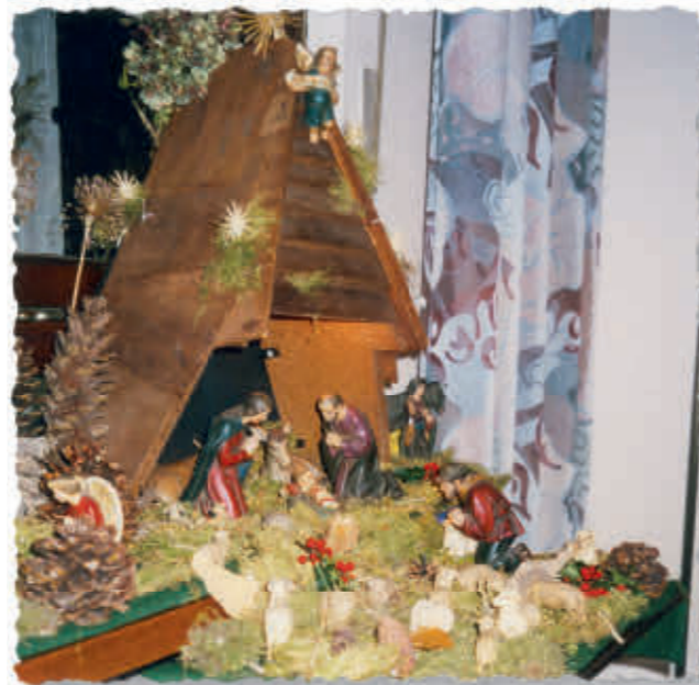
Abb. 24: Auf der Godesberger Fensterbank.