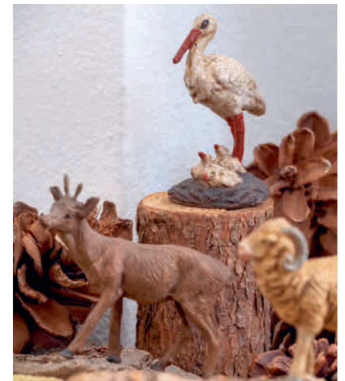
Abb. 28: Der „Elastolin“-Storch vom Bauernhof.

Da es sich bei Ihrer SH Schiestl um eine wenig werkgetreue Interpretation der Schiestl-Motive handelt, gibt es keine Vorlage, in der Sie Ihre Figuren 1:1 wiederfinden. Wohl aber tragen sie Züge, die durchaus als für Schiestl typisch angesehen werden dürfen und die Sie in den Darstellungen des Meisters auch wiederfinden werden. Allerdings sind es eher Andeutungen, denn Zitate. So hat Schiestl in keinem seiner Werke Tiere und in nur einem einzigen die Weisen gezeigt. Vieles blieb für die Modelleure daher von vorneherein Speku-