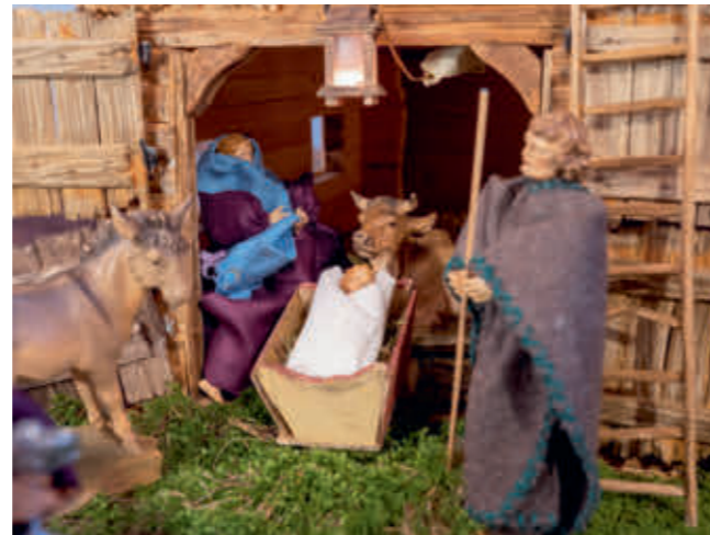
Abb. 3: Erst an Heiligabend kommt das Jesuskind dazu.

Doch die Arbeit fängt schon früher an. „Normal bin ich im Oktober unterwegs zum Moossammeln.“ Davon braucht er eine Menge. Es muss nicht nur schön dicht sein, sondern vor allem trocken. Damit er kein Ungeziefer oder Würmer in der Krippe hat, lässt Reuter Moos und andere Naturmaterialien ausgiebig trocknen.