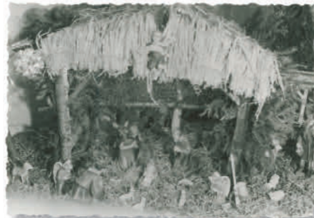
Abb. 23: Kleiner Krippenstall in Königswinter.

Zugleich wurde eine neue Tradition begründet: In diesen Jahren fand dann in unserem Haus am Ersten Weihnachtstag eine Familienfeier statt. An dieser nahmen alle Familienmitglieder teil. Wir wollen diese hier gerne