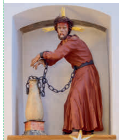
Abb. 7: Der leidende Jesus wurde viele Jahre verhüllt.