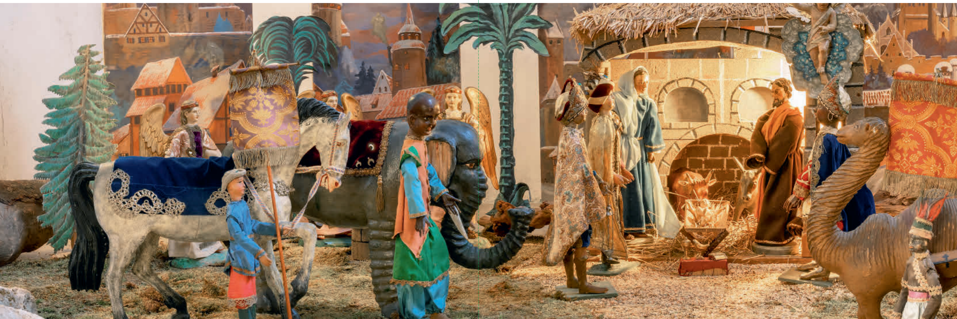
Abb. 9: Am 6. Januar wechselt die Szenerie. Die Heiligen Drei Könige kommen mit ihren Tieren.

Mag sein, dass die Palmen nicht zur Stadtkulisse passen, die Königsbegleiter nicht zu den anderen Figuren, mag sein, dass der Elefant seltsam ist und niemand weiß, woher die Figuren kommen. Dennoch bietet die Krippe insgesamt ein prachtvolles Bild. Gerade das Unperfekte hat einen eigenen Charme.