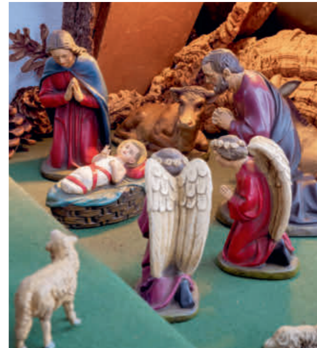
Abb. 27: Die Hl. Familie mit Anbetungseln.