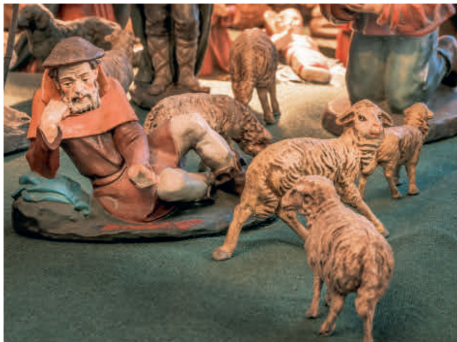
Abb. 26: Der Düsseldorfer Hirte.

Gipsfiguren hatten dabei in aller Regel eine sehr kurze „Halbwertszeit“, weshalb ständig Nachschub für Ersatzbeschaffungen rollen musste. Die Gipsfigurenindustrie war für ein paar Jahrzehnte eine Boombranche, die aufgrund der Beliebtheit und geringen Nachhaltigkeit ihrer Produkte aber weder von Wirtschafts- noch von Kunstwissenschaftlern ernst genommen wurde. Gestoppt wurde der Boom zunächst vom 2. Weltkrieg. Mit dem Aufkommen des Kunstharzes Anfang der 1950er-Jahre nahm man wieder merklich an Fahrt auf, da die neuen Produkte haltbarer waren und so selbst ganz viele Gipskrippenbesitzer noch einmal zu Neuanschaffungen griffen. In den 1960er-Jahren begann mit den Beschlüssen des Zweiten Vatikanischen Konzils der Abgesang auf die Branche. Heute kann seit Jahren kein einziger Betrieb mehr von der Inlandsnachfrage existieren – und das in einem Land, in dem früher einmal sicher weit über hundert Betriebe mit entsprechend vielen Angestellten ihr gutes Auskommen hatten. Nur Modelle, die bei der Käuferschaft gut ankamen, hatten eine längere Marktpräsenz. Manche Modelle wurden so über Jahrzehnte hinweg auch von unter-