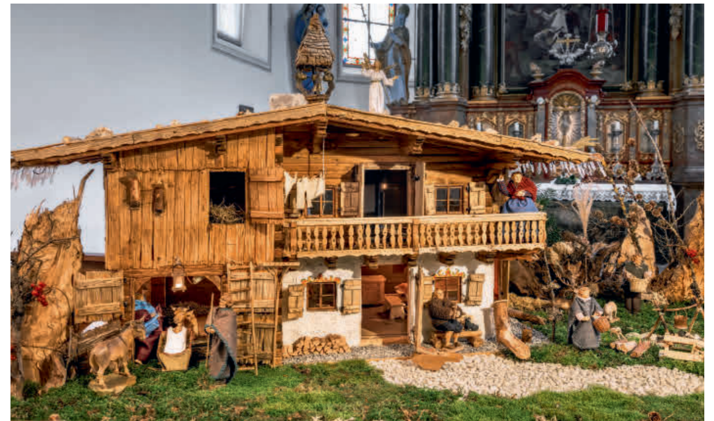
Abb. 1: Handgefertigte große alpenländische Krippe. Die Figuren tragen maßgeschneiderte Kleidung.