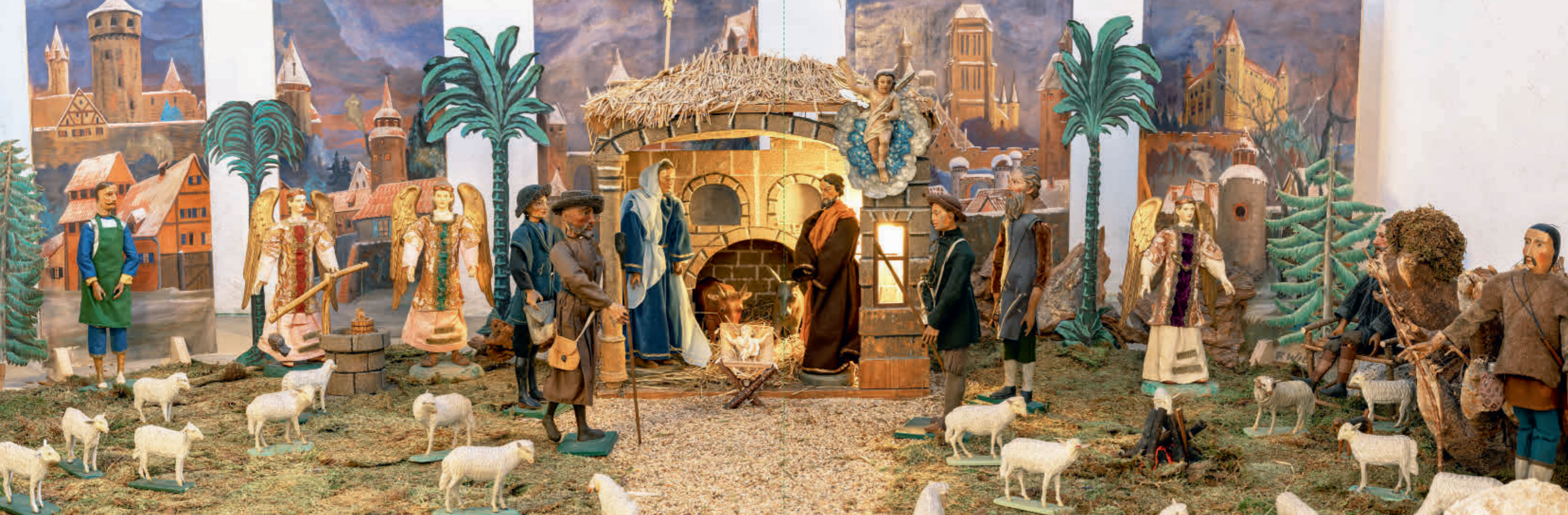
Abb. 6: Über den Ursprung bzw. die Herkunft der Krippe gibt es bis heute nur Vermutungen.