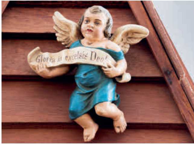
Abb. 22: Der Gloria-Engel.

böcken und langen Brettern wurde ein Tisch gebaut, etwa 1,80 x 3,00 Meter. An der Rückwand wurde ein Bild mit Winterlandschaft aufgehängt. Der Krippenstall und die Umrandung des Tisches waren aus echtem Baum-Kork. Bengalische Beleuchtung durch kleine bunte Lämpchen eingebaut. Daneben wurde der Weihnachtsbaum platziert. Heiligabend kam nun die ganze Familie Raueiser zum Krippenfest und Abendessen in die Wohnung.