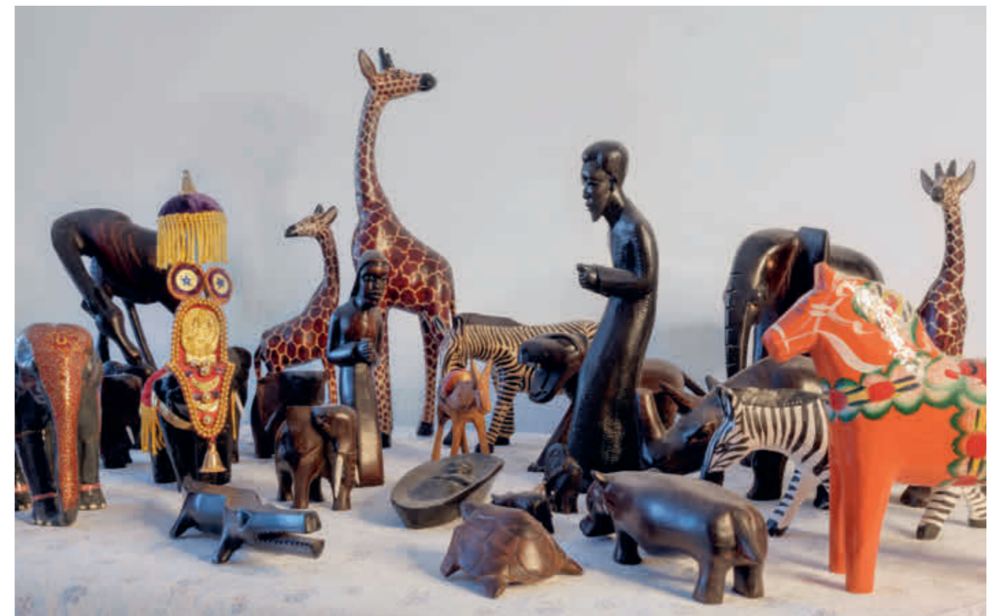
Abb. 33: Krippe oder Tierpark? Alle Tiere versammeln sich um Maria, Josef und das neugeborene Kind.

„Dann wohnt der Wolf beim Lamm, der Panther liegt beim Böcklein. Kalb und Löwe weiden zusammen, ein kleiner Knabe kann sie hüten. Kuh und Bärin freunden sich an, ihre Jungen liegen beieinander. Der Löwe frisst Stroh wie das Rind. Der Säugling spielt vor dem Schlupfloch der Natter, das Kind streckt seine Hand in die Höhle der Schlange. Man tut nichts Böses mehr und begeht kein Verbrechen auf meinem ganzen heiligen Berg.“