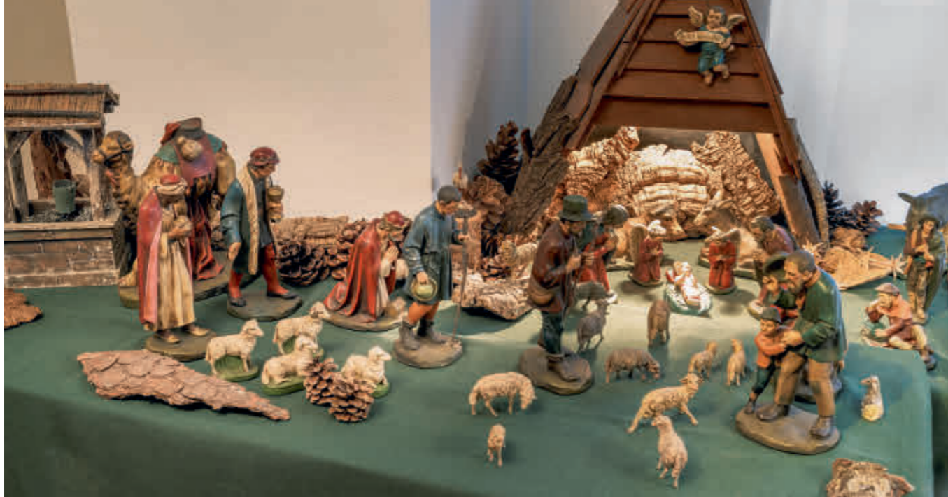
Abb. 29: Die frisch restaurierte Krippe in Irsee.

lation, weil die Branche auch für Schiestl Krippen an der 20-teiligen Sortierung festhielt.