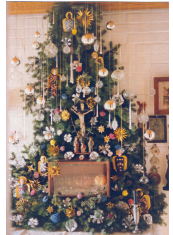
Abb. 18: Reich geschmückt – Weihnachtsbaum bei Raucheneckers.

Da die einzige Familienkrippe – vielmehr handelte es sich lediglich um eine Heilige Familie mit Wachsköp- fen, die die Wirren des Krieges überstanden hatte – bei der Großmutter mütterlicherseits verblieb, war es für meine jung verheiratete Mutter nur zu verständlich, angesichts der wachsenden Kinderschar eine eigene Krippe anzuschaffen. Mein Vater hielt sich heraus, für Haus und Kunst war meine Mutter zuständig. Auch wenn die nach und nach an Figuren wachsende Krippe in den Augen meiner Mutter „kindgerecht“ wirkte, damit spielen wollten wir nicht. Ehrfürchtig standen wir jedes Jahr an Heilig Abend zur Bescherung vor einem zauberhaft wirkenden und komplett anders als im Vor- jahr geschmückten Christbaum, der vom Boden bis zur