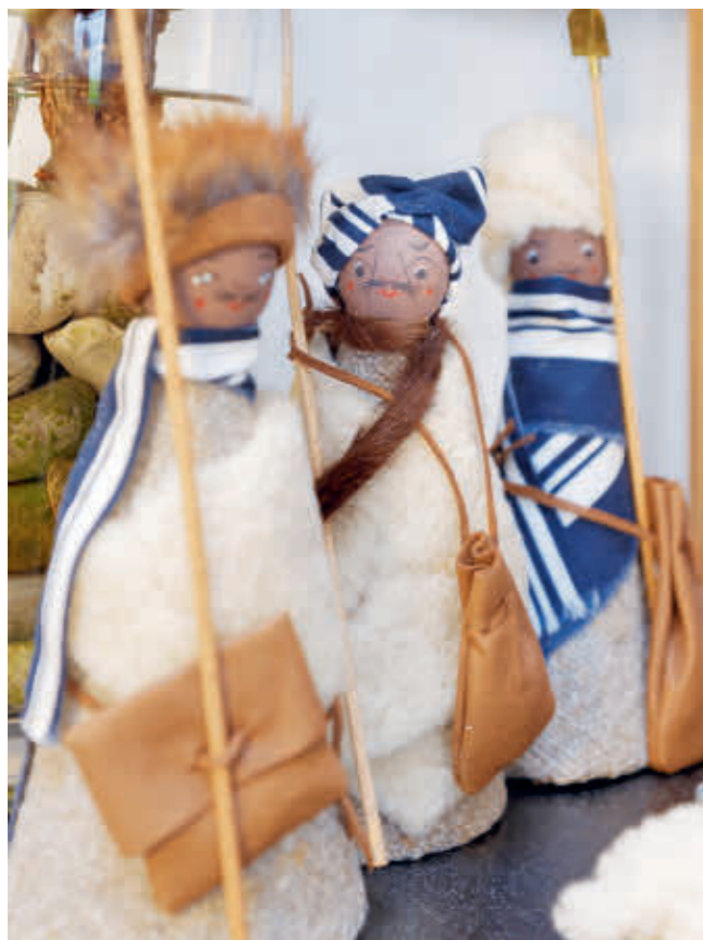
Abb. 16: Die Hirten mit Überwürfen aus echtem Fell.

später auch Osterlämmer in unterschiedlichen Größen. Die Krippenfiguren waren bei den Landshutern so begehrt, dass man sie lange im Voraus bestellen und mit viel Geduld auf deren Fertigstellung warten musste. Anders als bei den Dioramen barocker Krippen mit ihren vielfältigen Figurengruppen, die sich auf Szenen des Alten und Neuen Testaments oder Alltagsszenen beziehen, bestand eine Stälinger-Krippe aus der überschaubaren Anzahl folgender Figuren: der Heiligen Familie, also dem Jesuskind mit Maria und Josef. Ochs und Esel waren nie als ganze Figuren, sondern lediglich