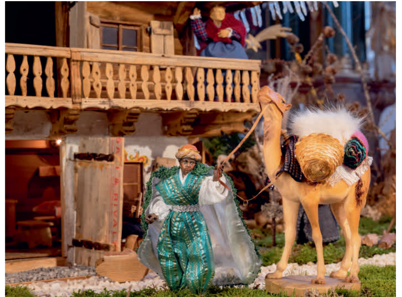
Abb. 4: Ankunft der Heiligen Drei Könige am 6. Januar.