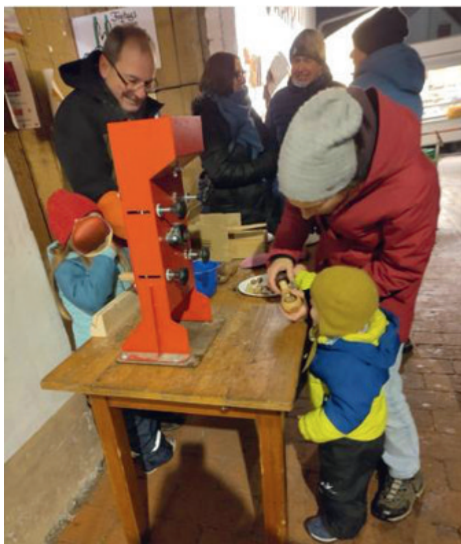
Kleine Nussknacker mit großer Maschine

Zum Gelingen des Projektes trugen wesentlich bei: Der Bund Naturschutz Irsee mit Unterstützung der beiden Ausstellungen, der Gartenbauverein mit seiner Obstpresse und der nostalgischen Kurbelmaschine zum Nüsse knacken, die UNESCO-AG der Josef-Guggenmos-Grundschule mit Spielen rund um die Streuobstwiese und ihr Freundeskreis mit den köstlichen, frisch frittierten Apfelküchle. Allen Beteiligten ein herzliches Dankeschön!