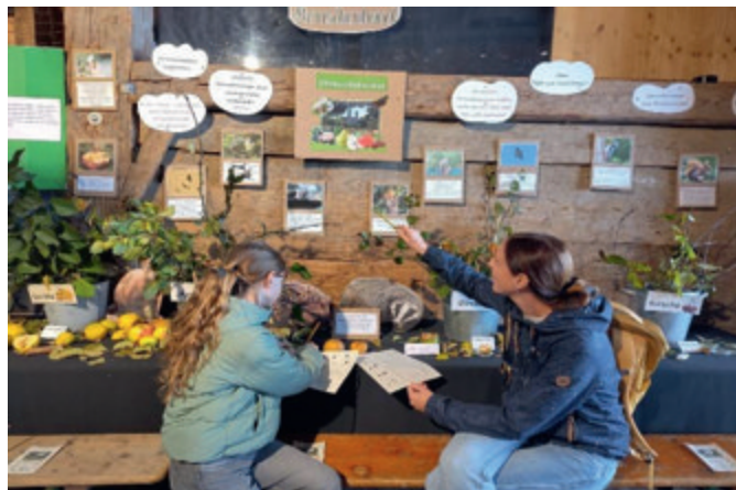
Mit Fleiß und Konzentration wird hier gerätselt.

Die Streuobstwiese, ein „Biotop aus Menschenhand“, stand diesen Herbst im Mittelpunkt des Marktgeschehens. Streuobstwiesen gehören zu den artenreichsten Lebensräumen Mitteleuropas, vorausgesetzt es wird weder gedüngt noch gespritzt. Obstbäume und Blühwiese, diese Kombination ist die Zauberformel für die Artenvielfalt von insgesamt 5000 Tierarten, vor allem Insekten und Vögel. Nicht umsonst wurden die Streuobstwiesen 2021 von der UNESCO zum „immateriellen Kulturerbe“ ernannt. Beginnend mit dem „Apfeltag“ im Oktober konnten in einer Ausstellung im Biomarkt-Stadel neben bekannten Obstbäumen auch alte und seltene Sorten wie Quitte, Mispel oder Speierling besichtigt werden. In einem dazugehörigen Rätsel setzten sich die zahlreichen Rätselfreunde u.a. damit auseinander, welche Tiere vom Fallobst profitieren, warum Schwalben und Fledermäuse gerne in der Nähe von Streuobstwiesen fliegen und sogar Läuse ihr Gutes haben.