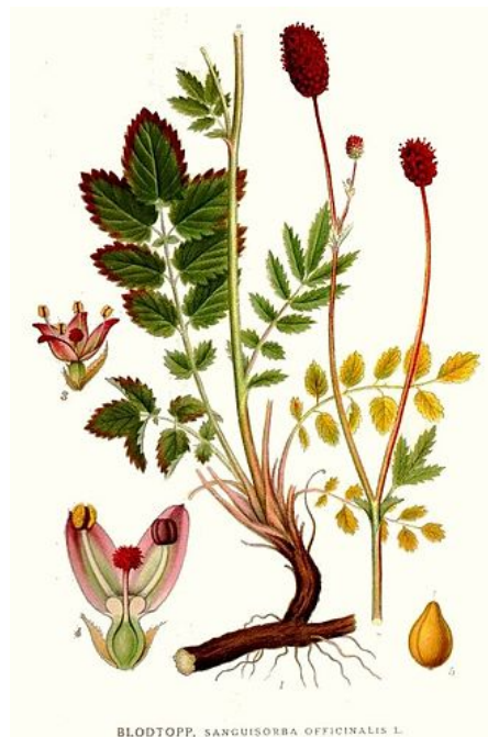
Illustration aus: Carl Axel Magnus Lindman: Bilder zur Nordens Flora

Ein wunderbares Vorkommen vom Großen Wiesenknopf in der Gemeinde Halblech befindet sich auf den Nasswiesen des Rieder Filzes.