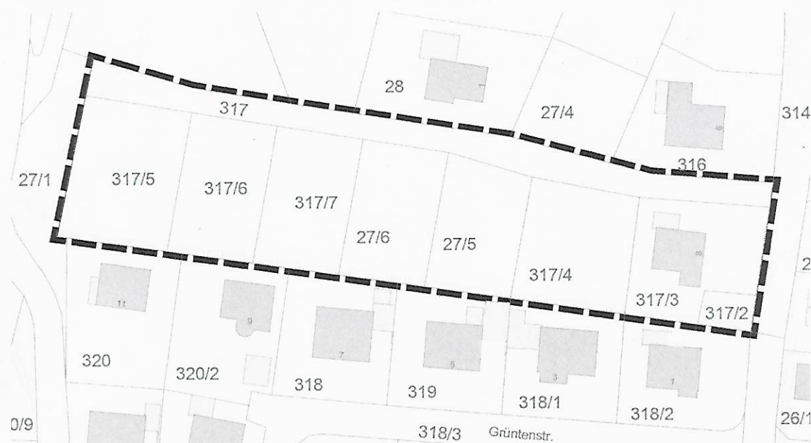
Abbildung 1: Lage-

Im Einzelnen gilt der Lageplan vom 07.12.2021. Der Lageplan ist im folgenden Kartenausschnitt dargestellt :